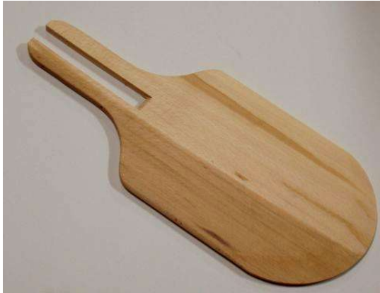
Pellon / Pelle BELGE