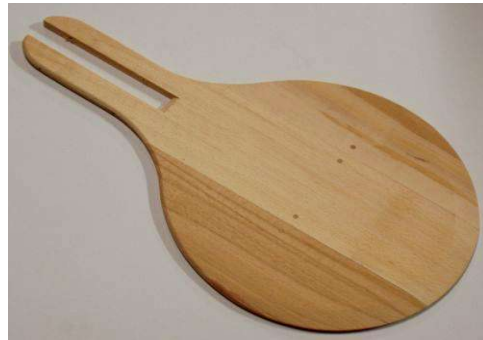
Pellon / Pelle RONDE

50 x 40 80 x 35 100 x 35 60 x 40 80 x 40 100 x 40 60 x 45 80 x 45 100 x 45 70 x 40 90 x 40 70 x 45