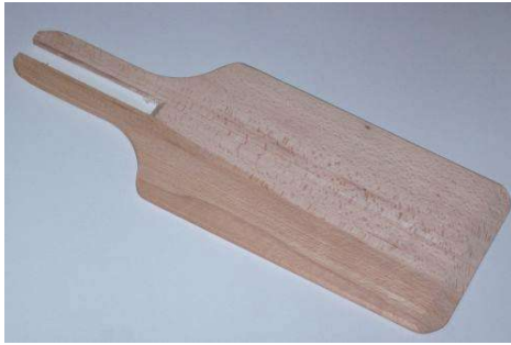
Pellon / Pelle PATISSIERE