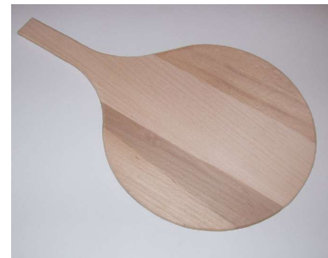
Modèles à manche intégré

1 - manche 25 x 25 coupé droit 2 - manche 22 x 27 pointé pour nos pellons 3 - manche 22 x 27 bout Ø 22 droit 4 - manche 22 x 27 bout Ø 25 pointé