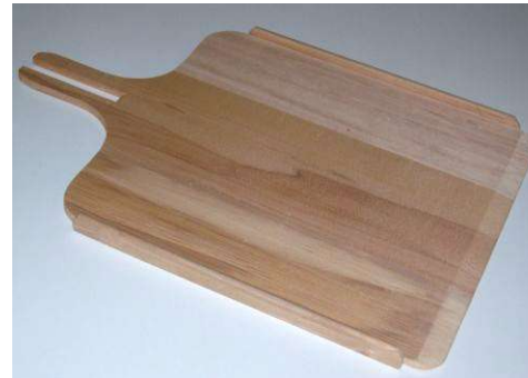
Pellon / Pelle REBORDS