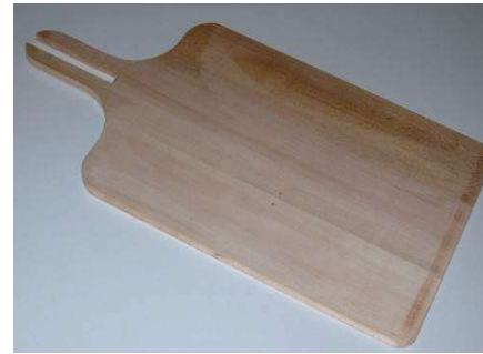
Pellon / Pelle VIENNOISE

60 x 16 80 x 20 60 x 18 80 x 22 60 x 20 80 x 24 60 x 22 60 x 24 33 x 33 60 x 30